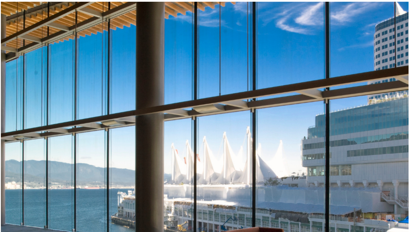
Float Glas DIAMANT van Saint-Gobain Building Glass