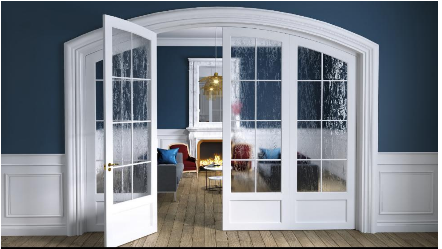
SGG DECORGLASS als glazen deur | Saint-Gobain Building Glass