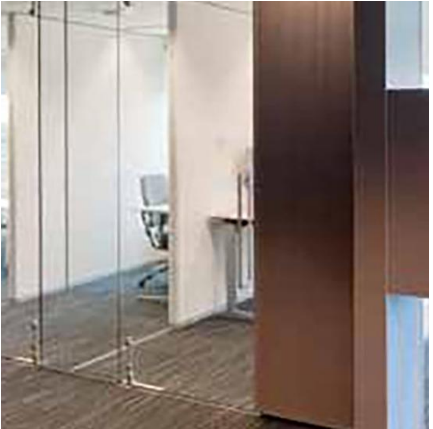
SYSTEMS (CLIP-IN) SILENCE