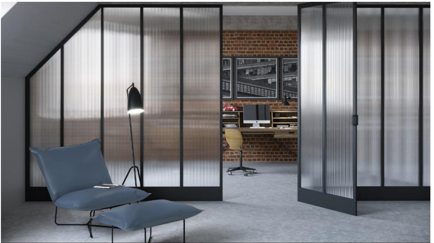
Helder & gekleurd figuurglas voor een mooi interieur met voldoende privacy | SGG DECORGLASS