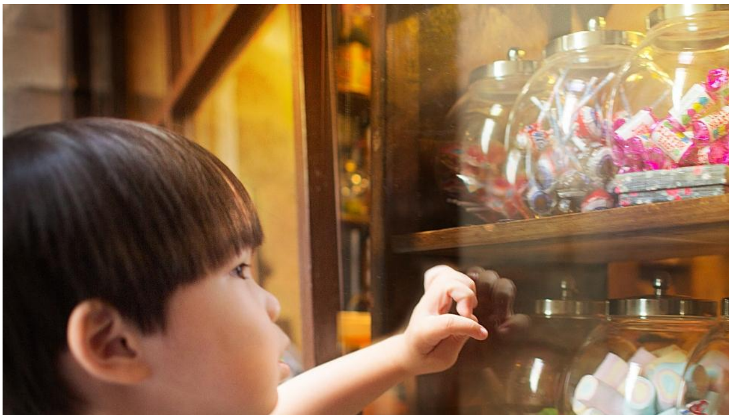
De beste vitrines zijn die met ontspiegelend glas