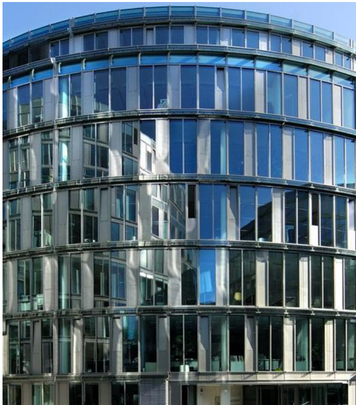
Buigbaar & zonwerend glas COOL-LITE ST 150 | Saint-Gobain Building Glass