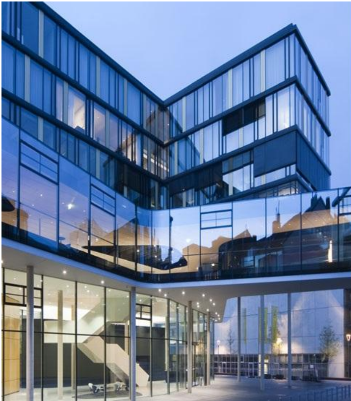
COOL-LITE ST 150 voor glazen gevels | Saint-Gobain Building Glass