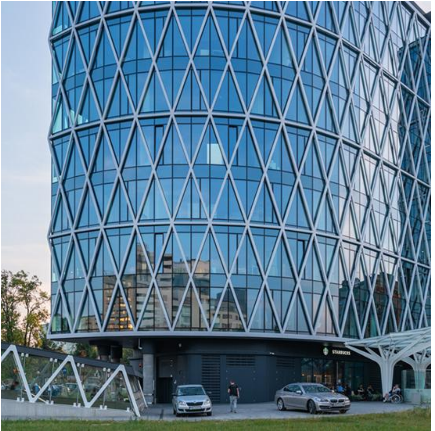
COOL-LITE SKN 154