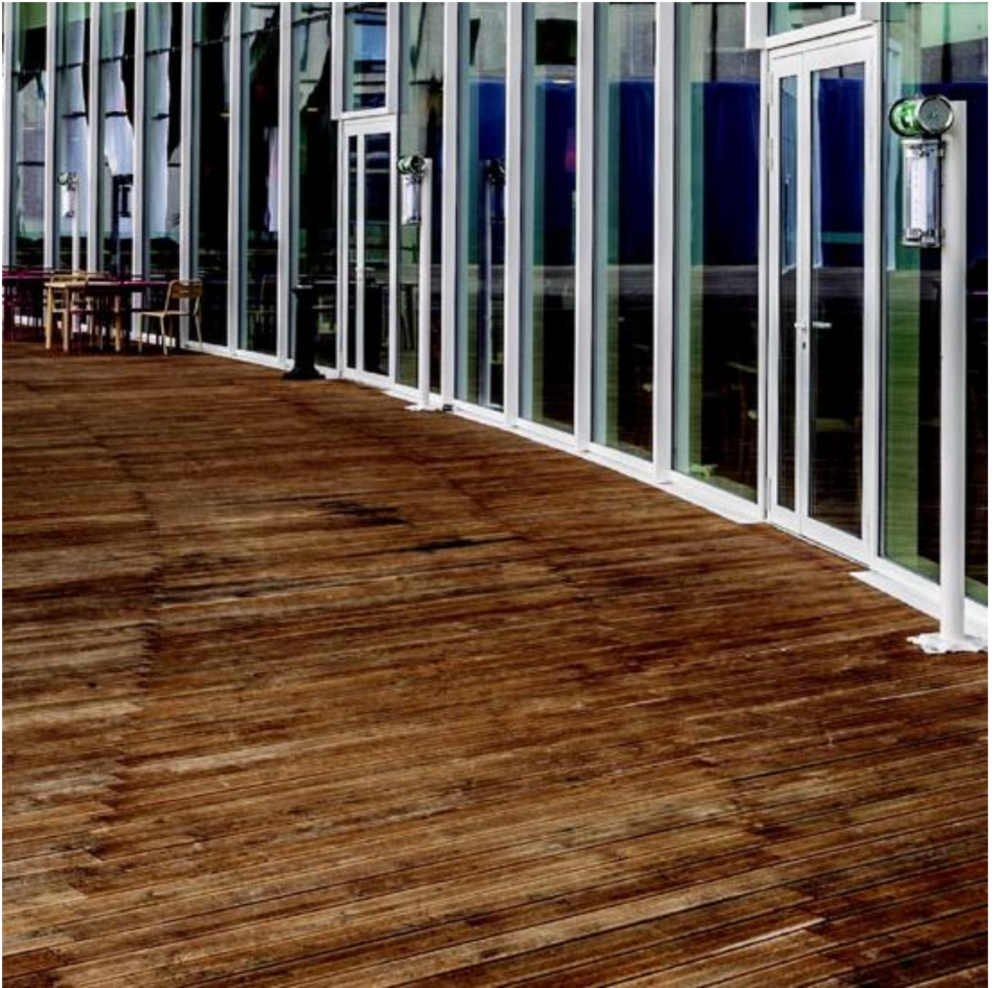
COOL-LITE SKN 145