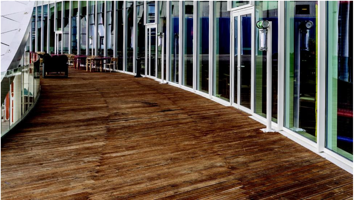
SGG COOL-LITE SKN 145 | Zonwerend isolatieglas | Saint-Gobain Building Glass