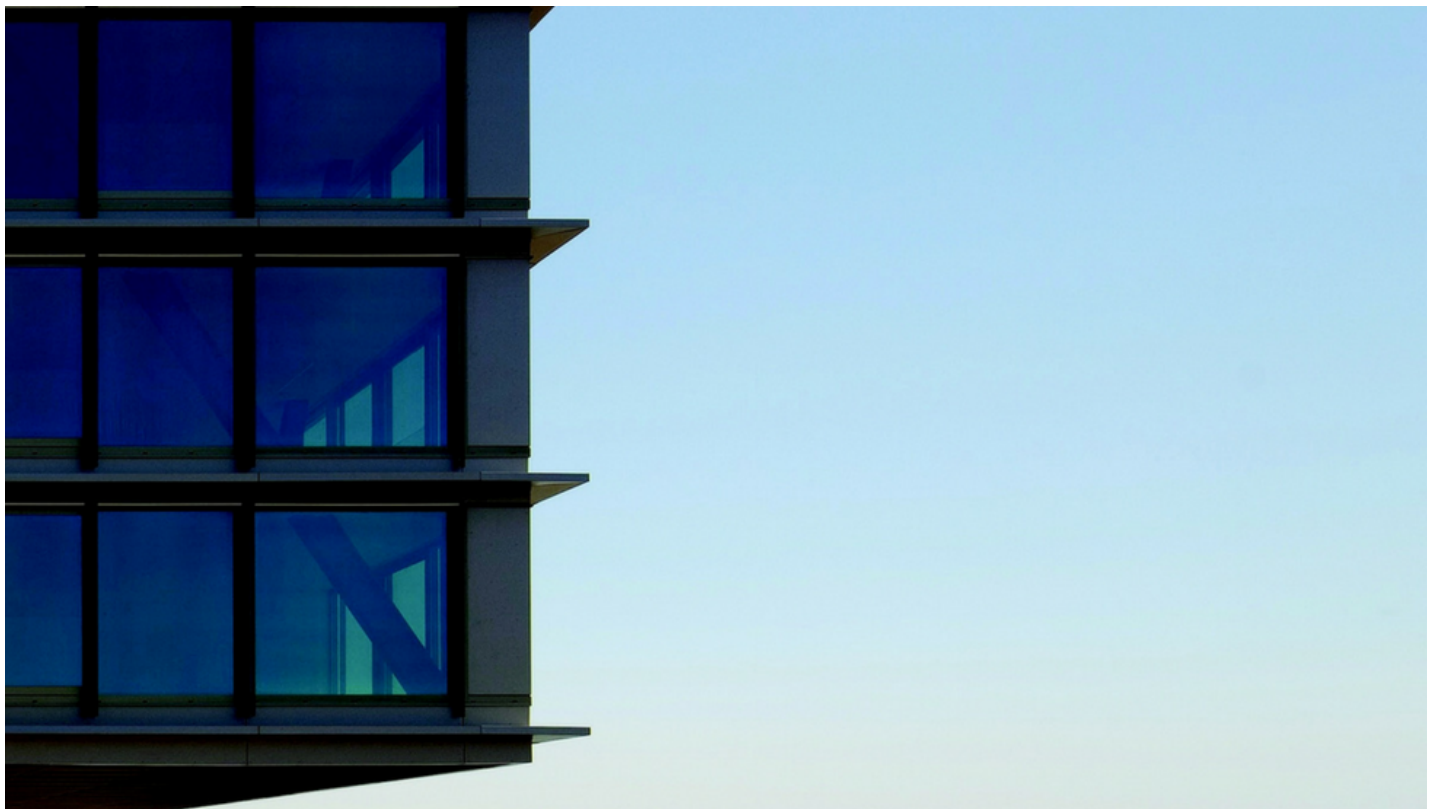
Zonwerende beglazing COOL-LITE SKN 145 | Saint-Gobain Building Glass