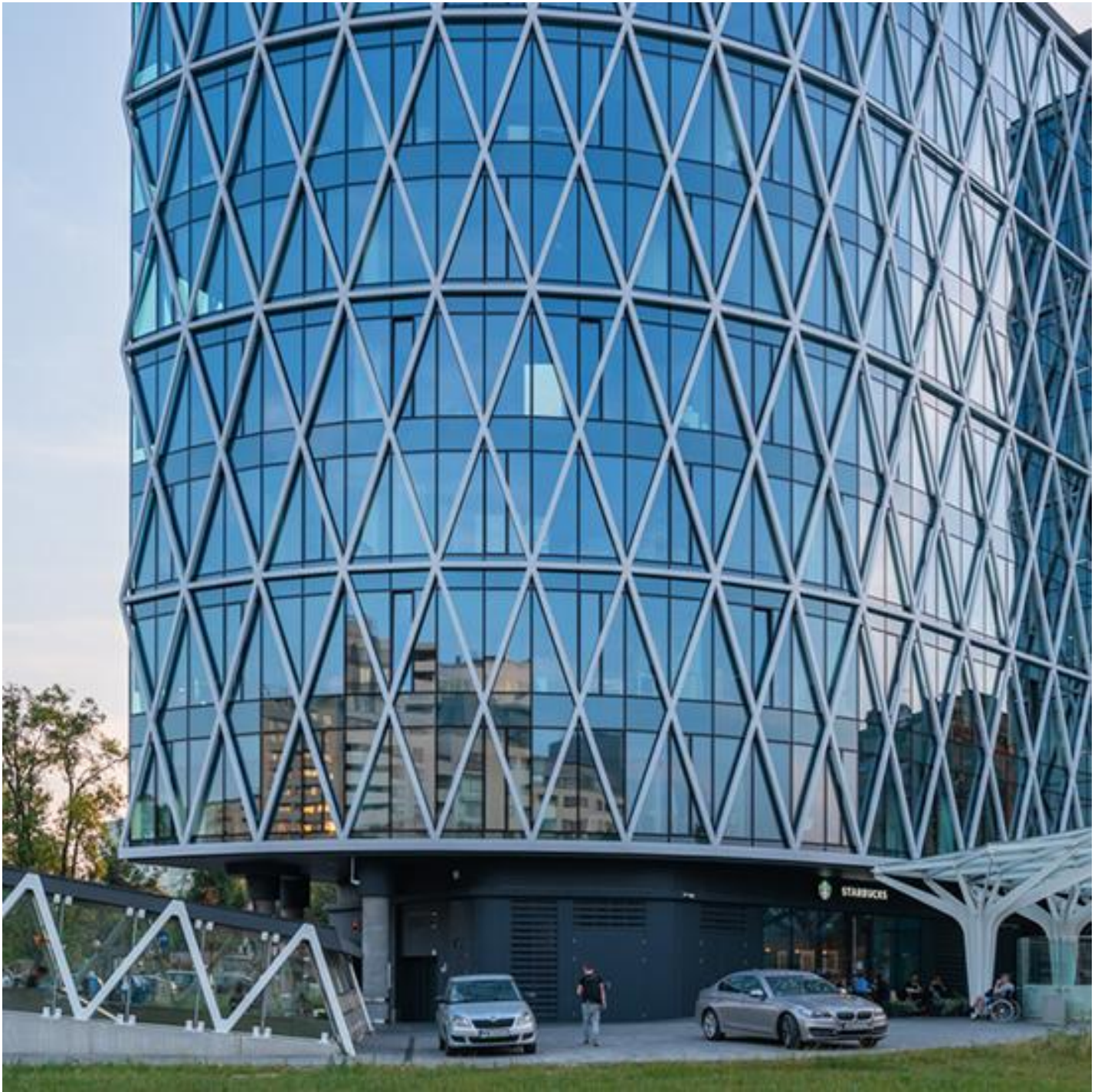
COOL-LITE SKN 154