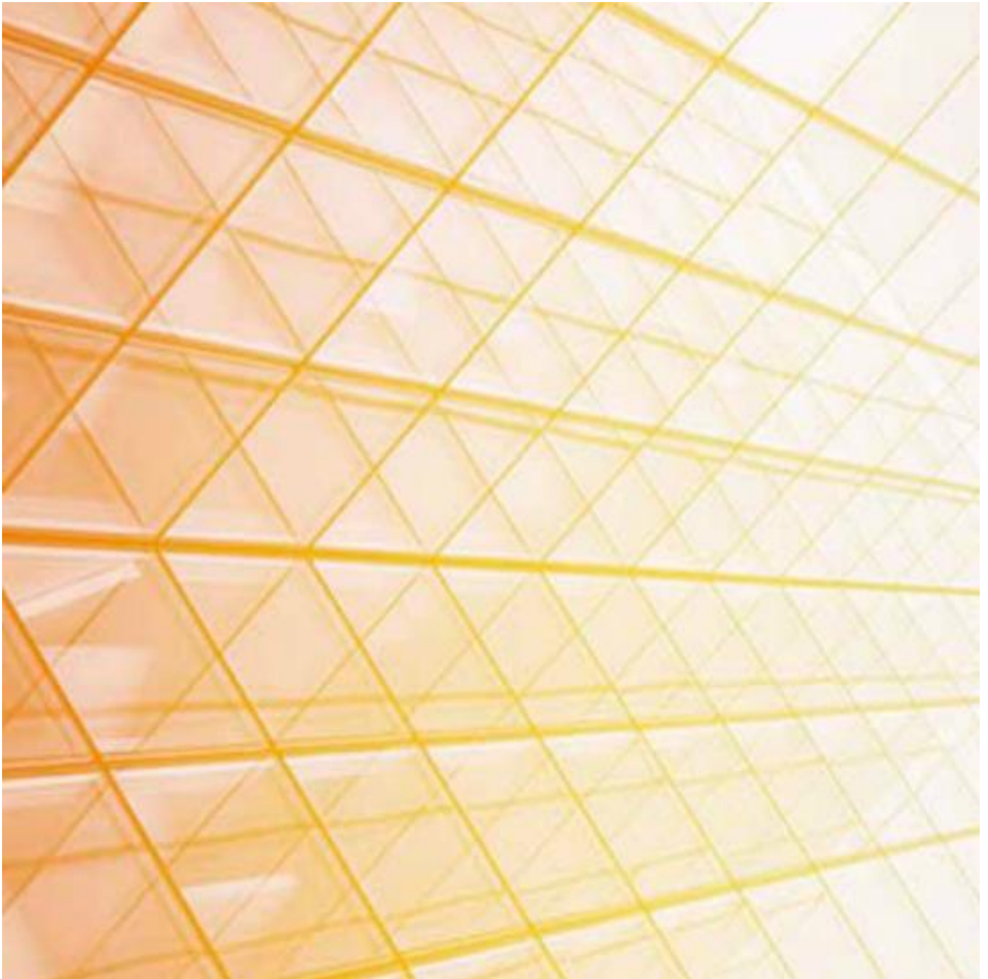
COOL-LITE KG 137

Overige zonwerende oplossingen voor uw beglazing