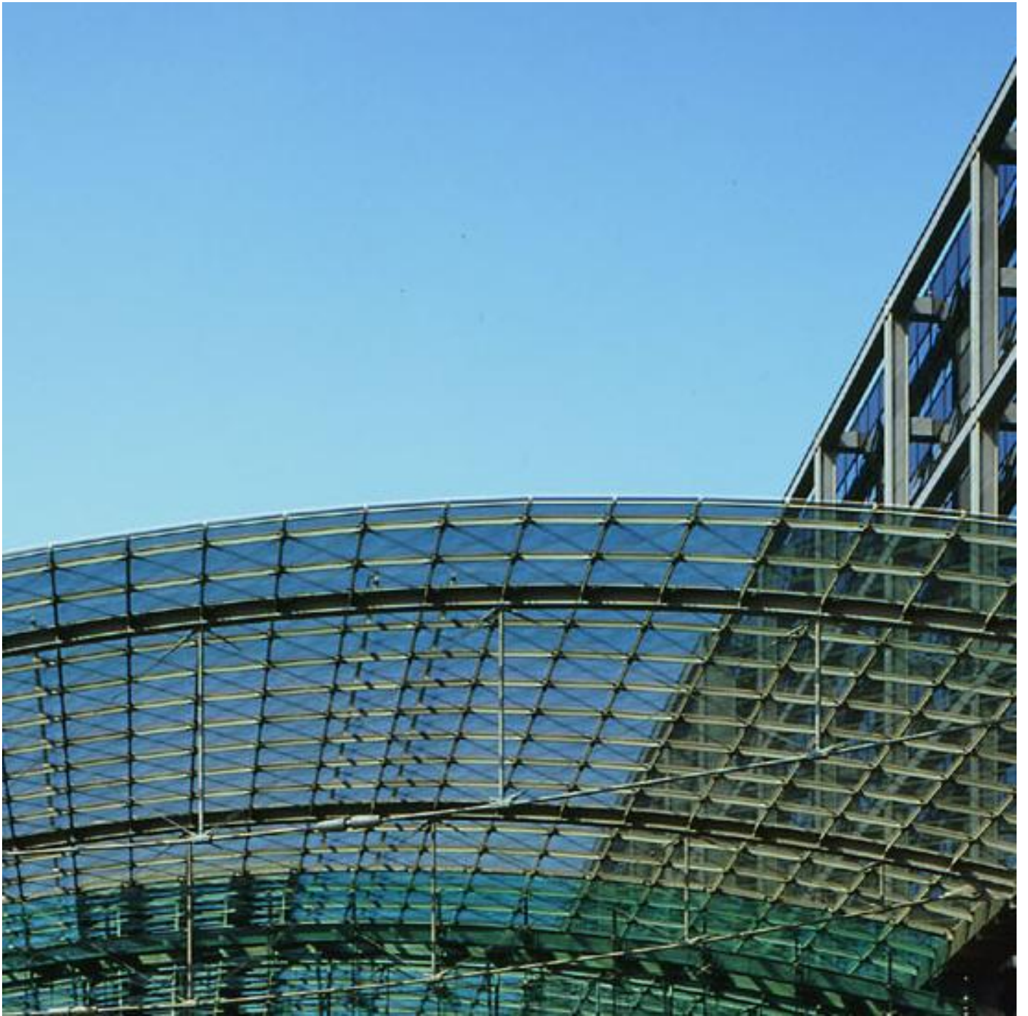
COOL-LITE SKN 165