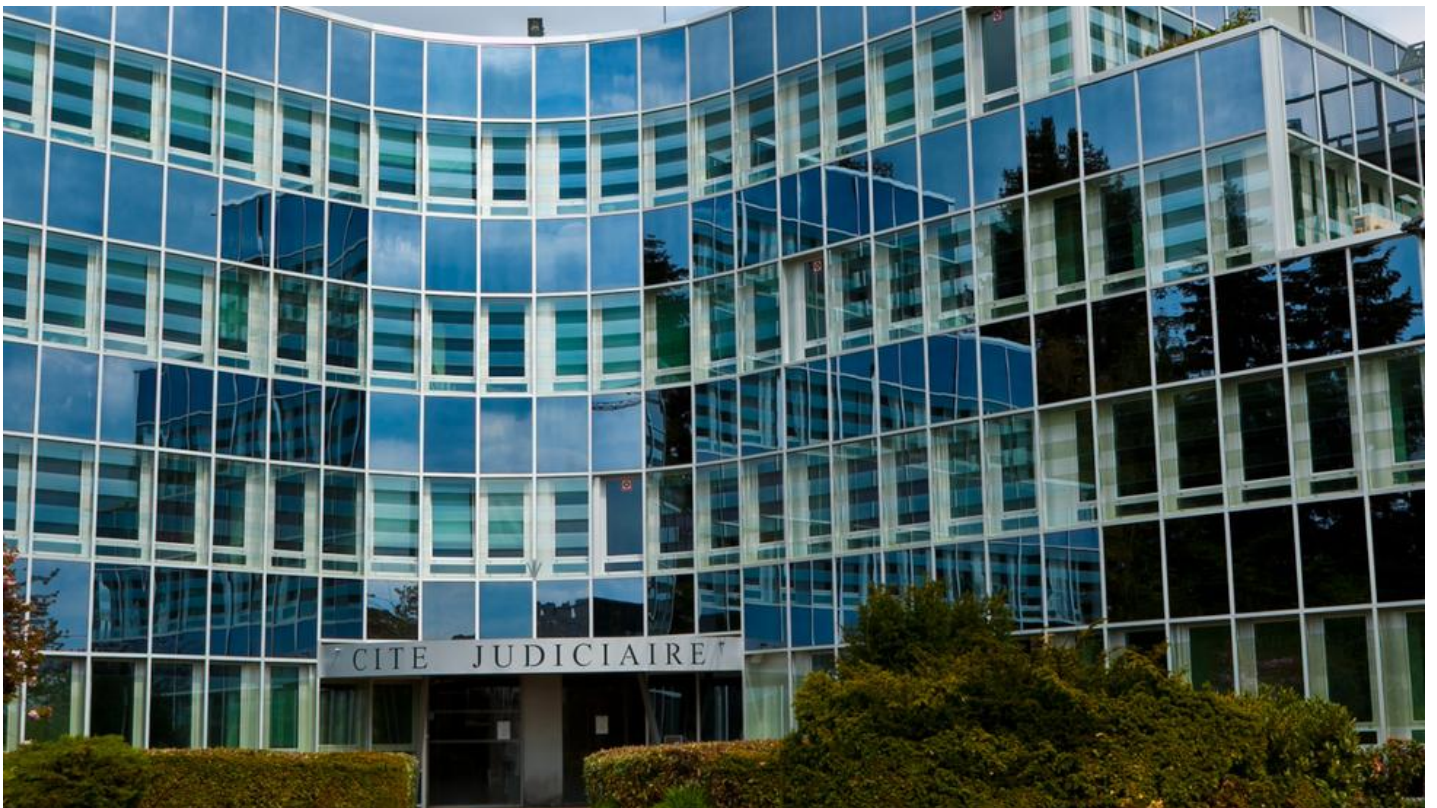
Flexibel & transparant hoogrendementsbeglazing COOL-LITE ST BRIGHT SILVER | Saint-Gobain Building Glass