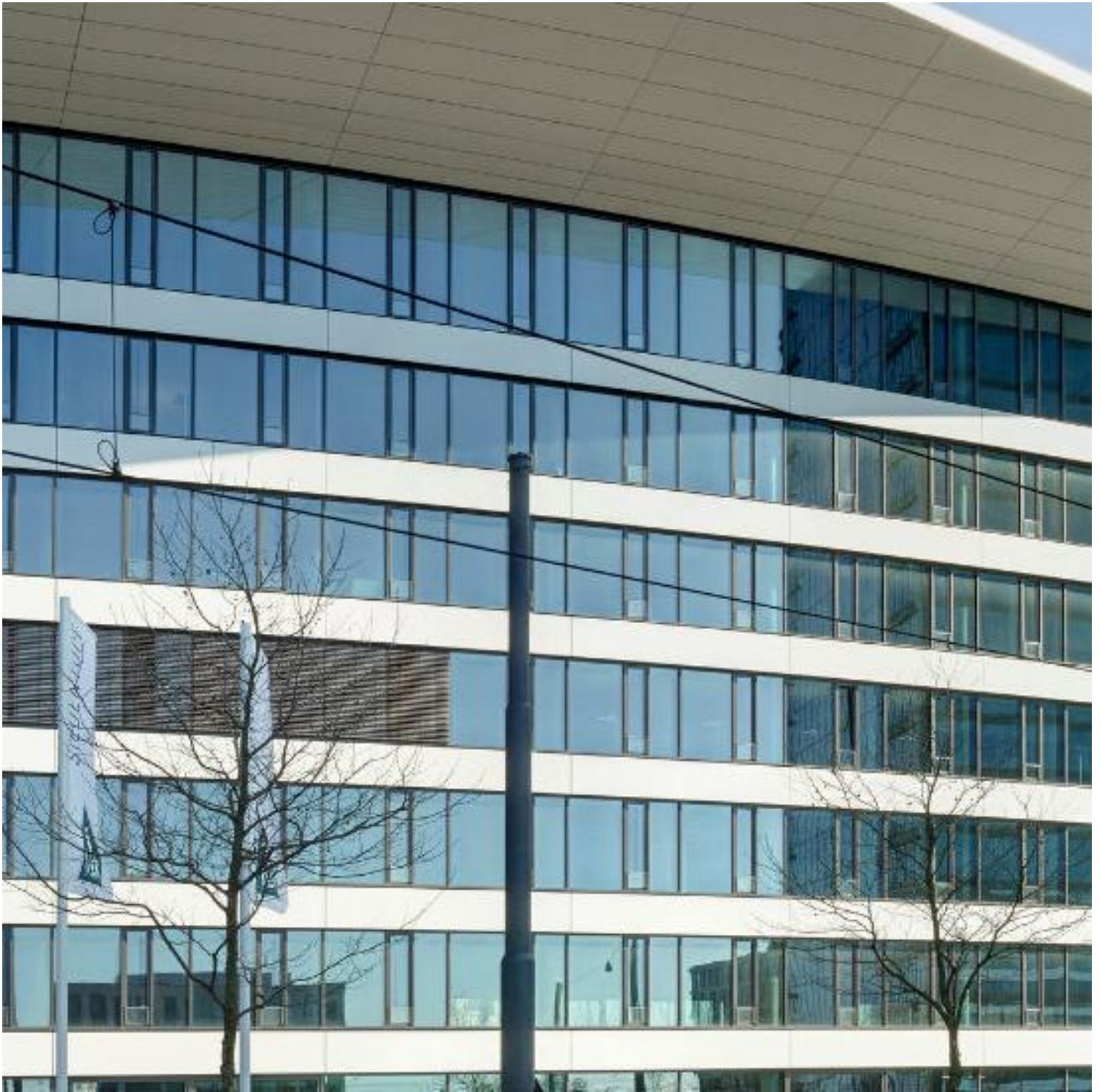
COOL-LITE SKN 176