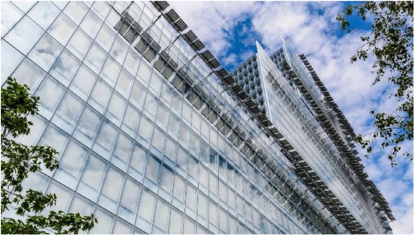
COOL-LITE ST BRIGHT SILVER