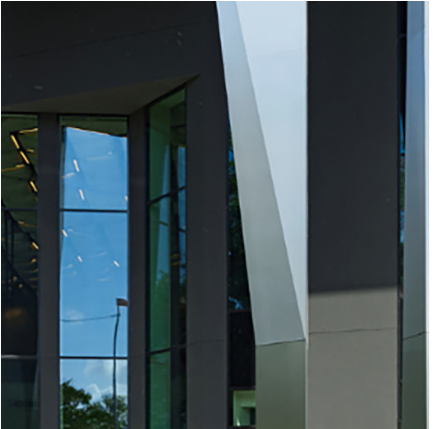
COOL-LITE XTREME 60/28