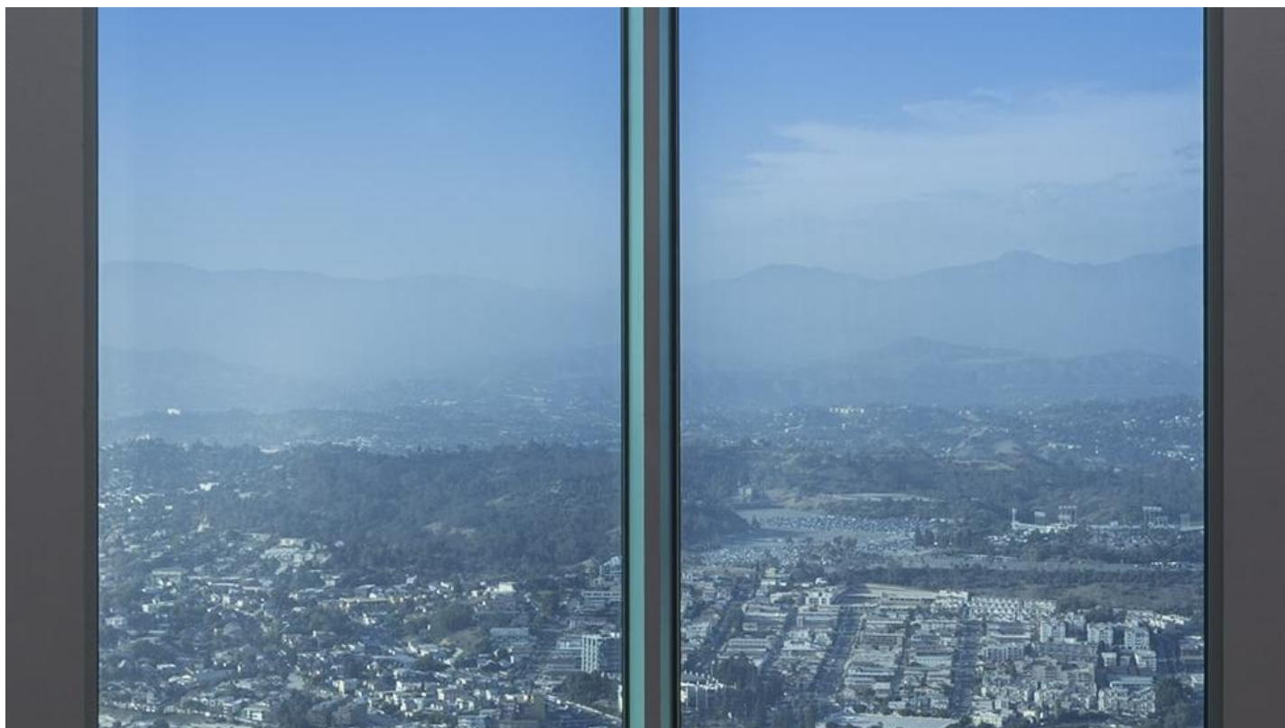
Nooit meer overlast van zon, warmte en licht dankzij SAGEGLASS