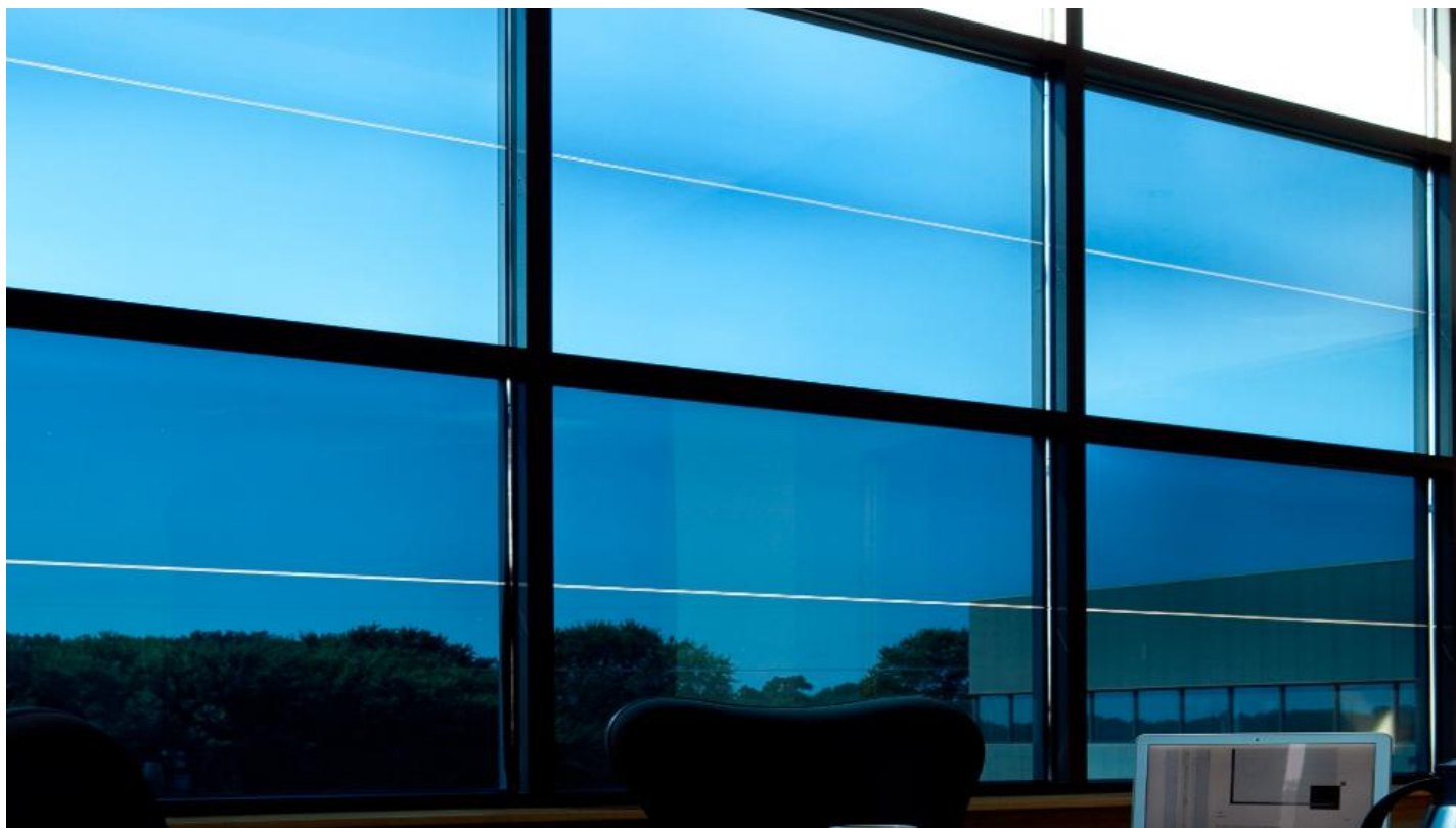
Dynamisch, elektronisch tönbares Glas | Sageglas von Saint-Gobain Building Glass