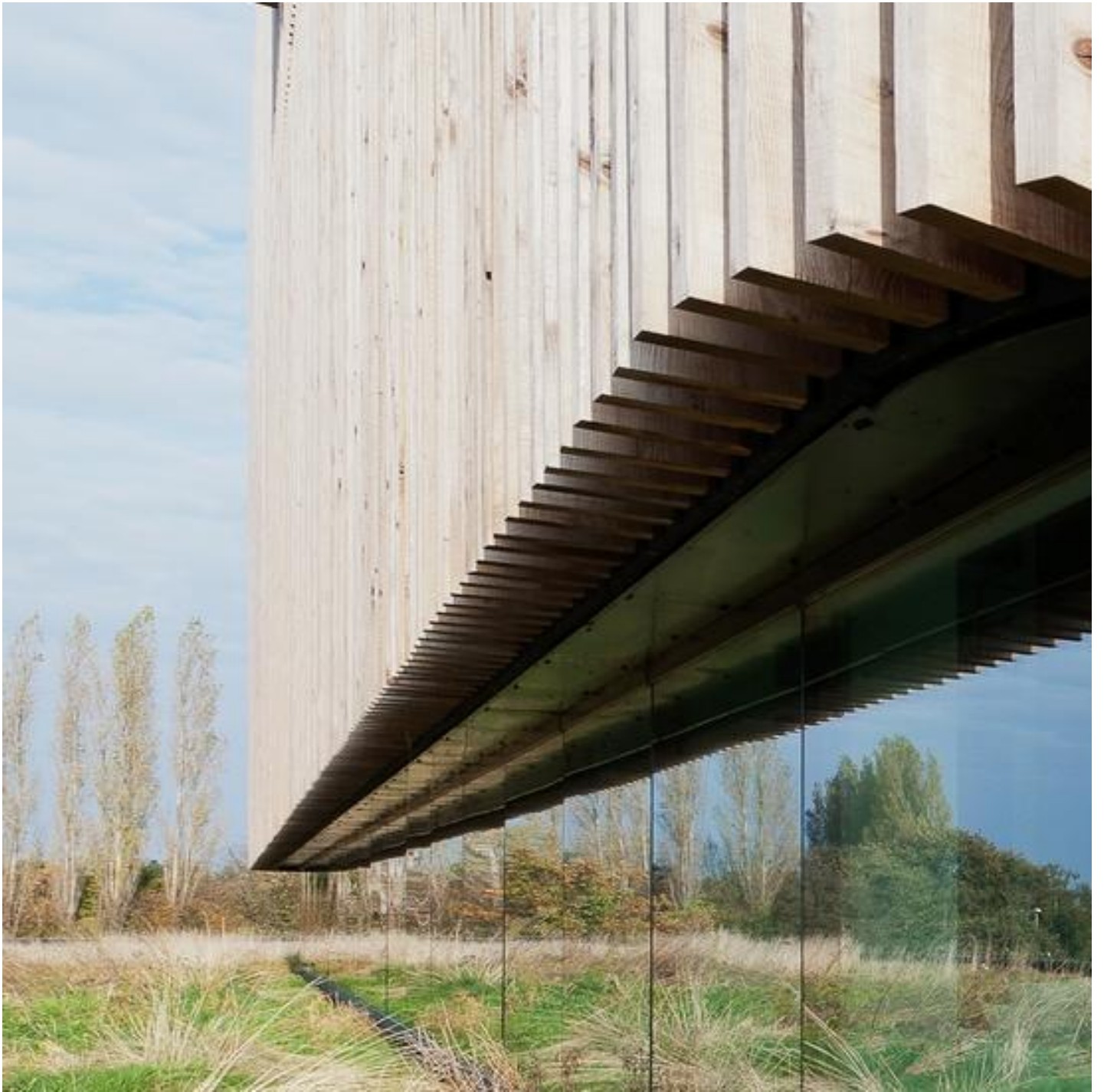
COOL-LITE ST 150