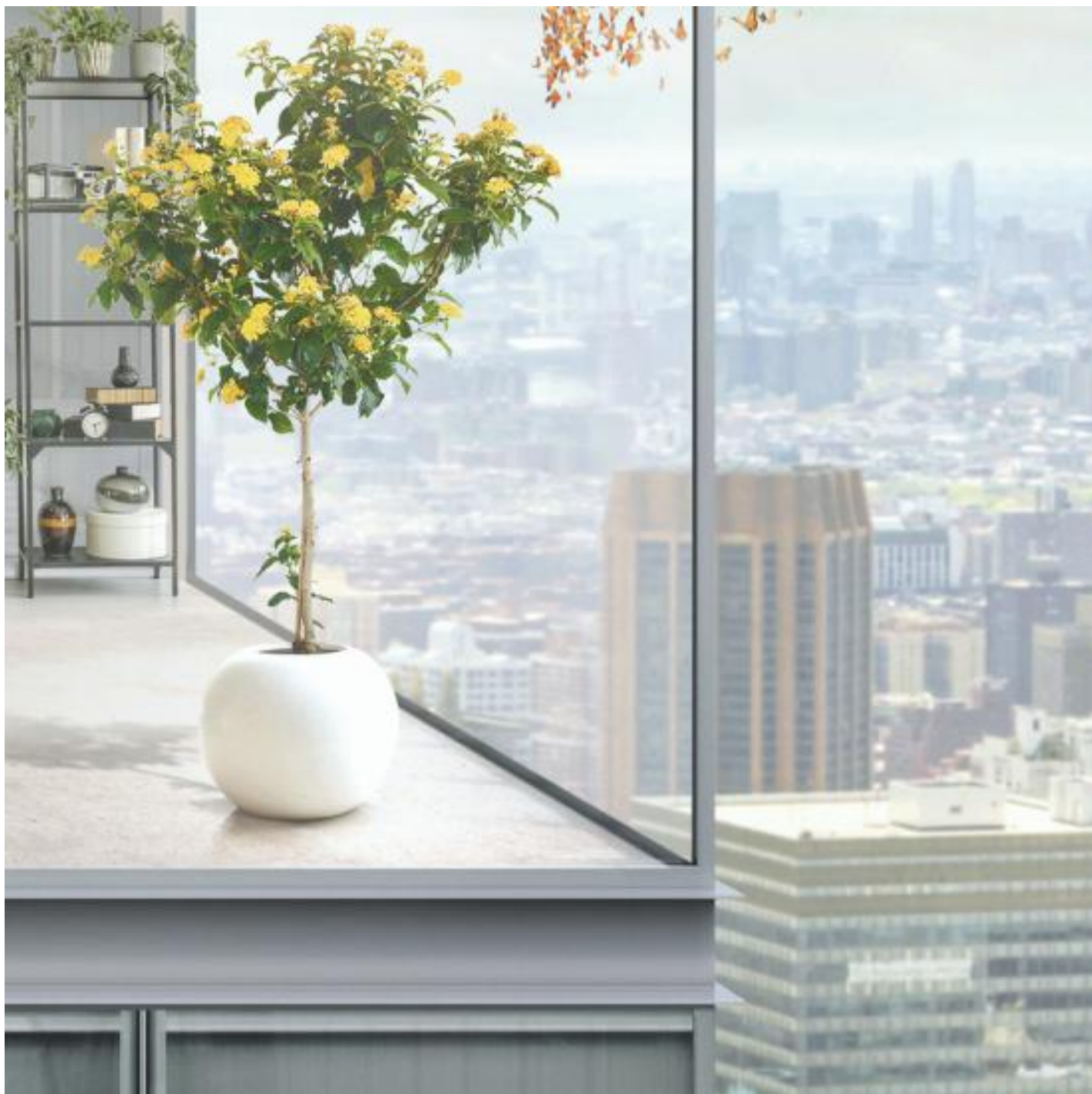
COOL-LITE XTREME 70/33

Ontdek de andere mogelijkheden om de zon te weren via uw beglazing