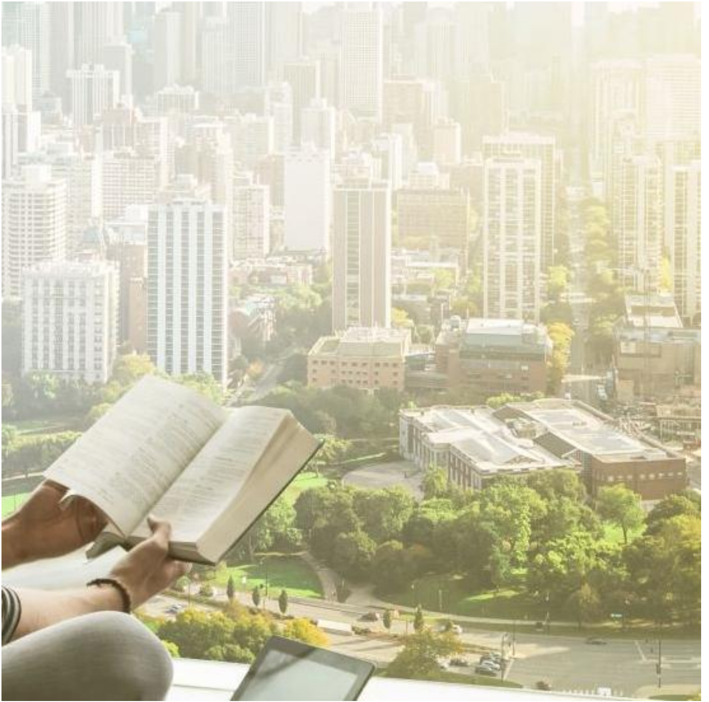
COOL-LITE SKN 183