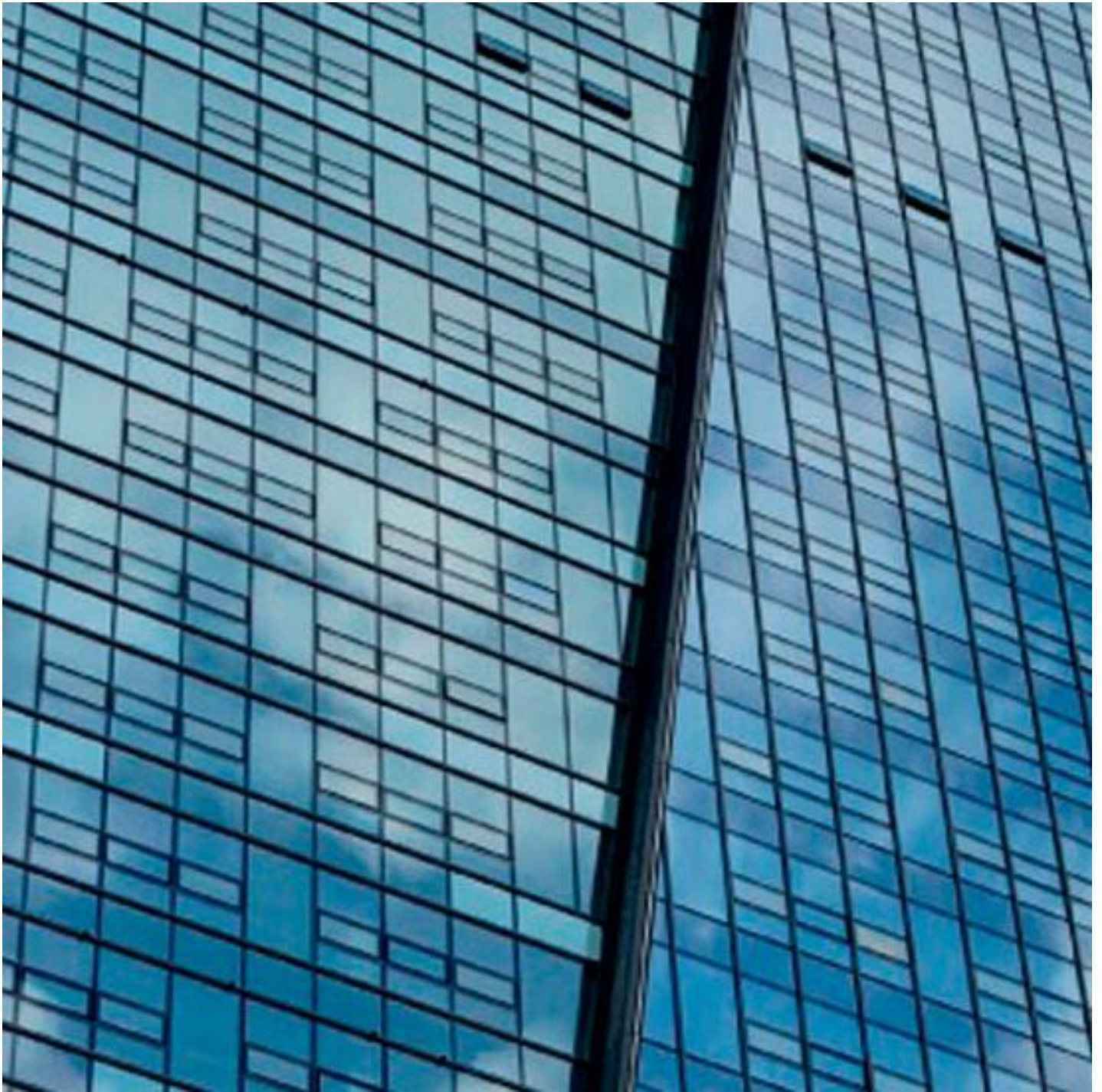
Glas voor façade